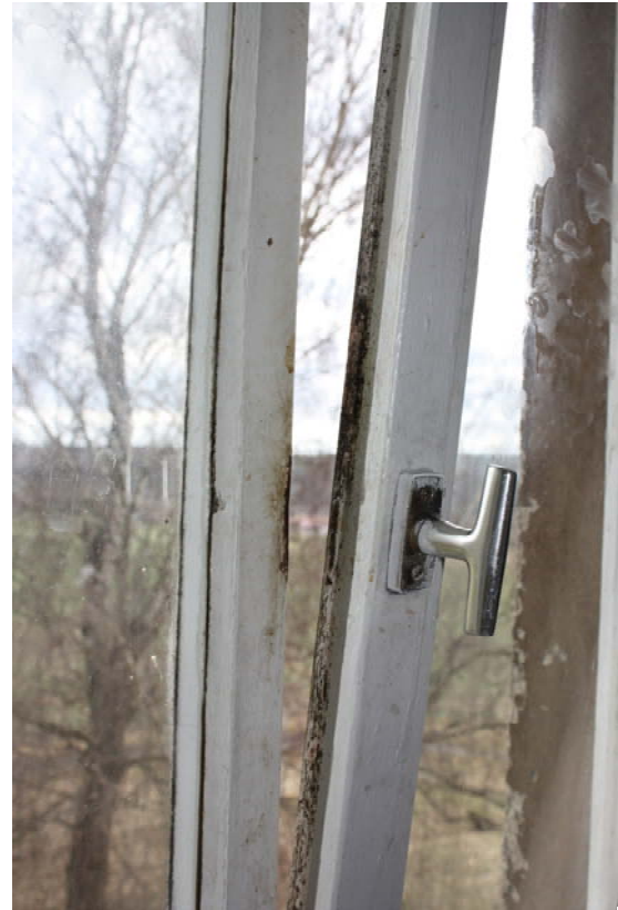
Ein Zimmer im Flüchtlingslager Hardheim – Schimmelbefall an den Wänden, Decken und um die Fenster