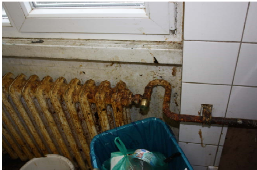
Gemeinschaftsküche des Isolationslagers im zweiten Stockwerk

Der afghanische Familienvater erzählte uns, dass drei seiner vier Söhne seit ihrem Aufenthalt an Asthma leiden. Eine ärztliche Bescheinigung beschreibt die mangelnde Hygiene im Heim. In ihr wird festgestellt, dass die Zimmer (Anmerkung der Delegation: ,die von mehreren Menschen bewohnt werden,) nicht ein