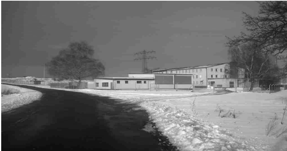
Isolationslager in Hardheim, Neckar-Odenwald-Kreis

Auf der Hinfahrt zum bundesweiten Treffen der KARAWANE für die Rechte der Flüchtlinge und MigrantInnen besuchte am 5. Februar 2011 eine Delegation aus Wuppertal das Isolationsheim in Hardheim im fränkischen Odenwald, in Neckar-Odenwald Kreis. Die Flüchtlingsinitiative Biberach und THE VOICE Refugee Forum Baden-Württemberg hatten uns auf die miserabele Situation der Flüchtlinge dort und über die praktizierte Isolation informiert.